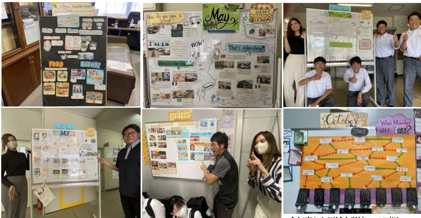
今年度から川越中学校の ALT (川